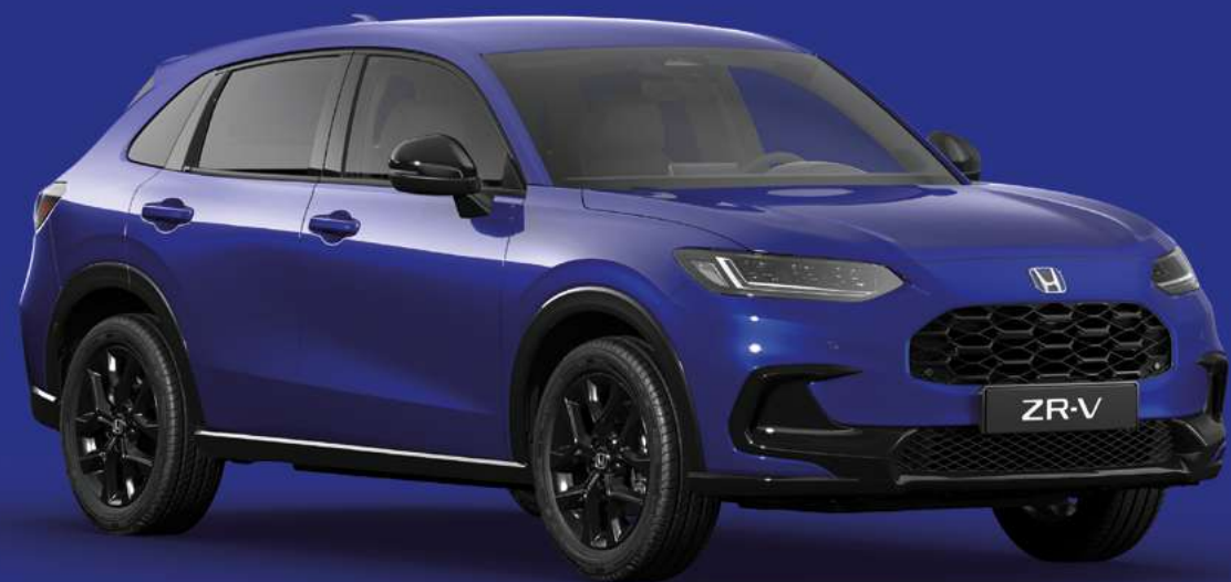
STILL NIGHT PEARL

Jūsų pasirinkimui siūlome plačią paletę šiuolaikinių spalvų, kurios padės atskleisti jūsų individualų skonį ir dinamišką ZR-V stilių.