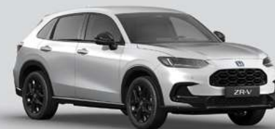
DIAMOND DUST PEARL