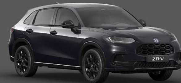
RUSE BLACK METALLIC