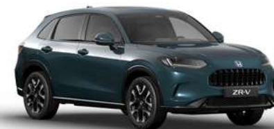
NORDIC FOREST PEARL