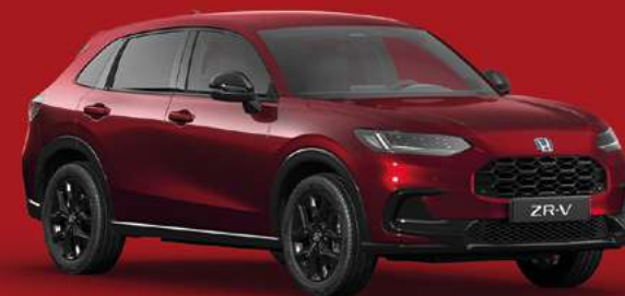
RADIANT RED METALLIC