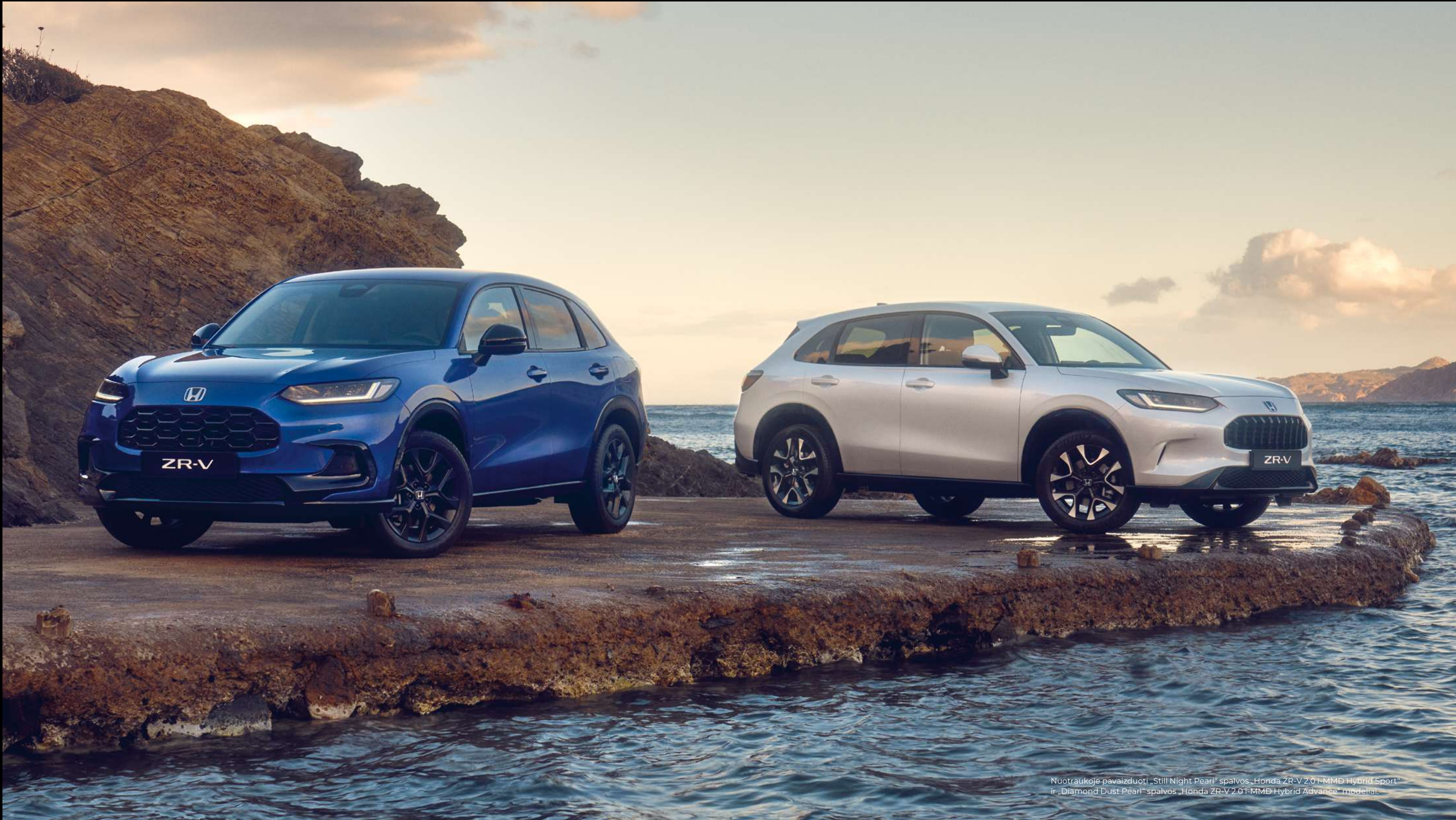
Nuotraukoje pavaizduoti „Still Night Pearl“ spalvos „Honda ZR-V 2.0i-MMD Hybrid Sport“ ir „Diamond Dust Pearl“ spalvos „Honda ZR-V 2.0i-MMD Hybrid Advance“ modeliai.